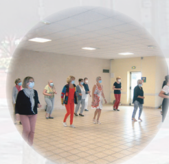
Reprise des cours de gymnastique volontaire