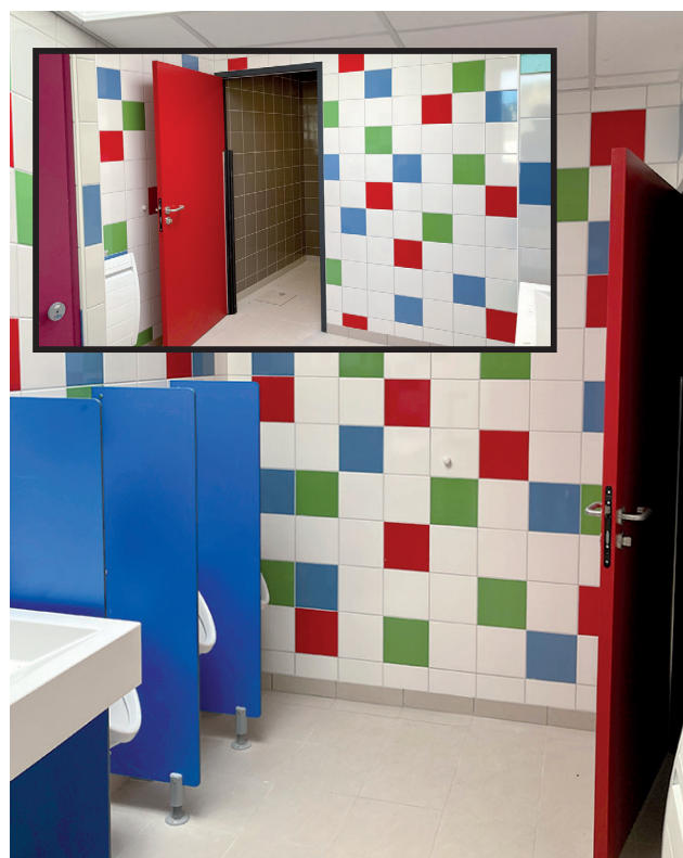
Sanitaires filles et garçons