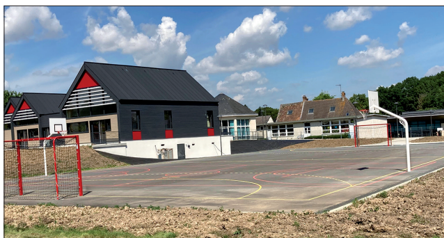
Centre de Loisirs Sans Hébergement et plateau sportif.

La construction du Centre de Loisirs Sans Hébergement touche à sa fin. Les travaux de second œuvre ont débuté en janvier et sont maintenant en phase d'être finis. Les derniers travaux d'installation des équipements intérieurs sont en cours : pose des stores, des éviers, des habillages pour les appareils de chauffage, des signalétiques, des tableaux d'affichage ainsi que la réalisation de petits travaux de finition.