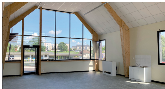
Grande salle (100 m 2 ), équipée de placards de rangement et d'un point d'eau.

La réalisation du terrain multisports, aménagé pour les enfants accueillis au centre de loisirs et à l'école élémentaire, est terminée.