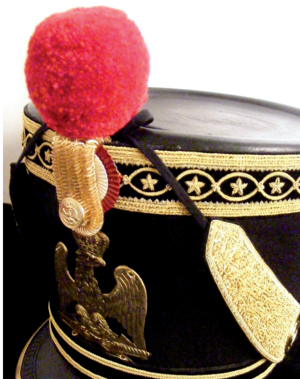
Sakho du baron

Célèbre combattant de l'épopée impériale, soldat du 6 ème Hussards, au 15 brumaire an 7, lieutenant grenadier en 1806, capitaine de la garde en 1811, commandant du régiment des flanqueurs en 1813 et major du 11 ème régiment d'infanterie de la ligue en 1814, le baron fit les campagnes de l'armée d'Espagne en 1803, de la grande armée en 1806 et 1807, de l'armée du Rhin en 1808 et 1809, d'Allemagne en 1809, de Saxe en 1813 et de France en 1814.