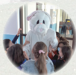
La mascotte «lapin» rend visite aux enfants dans les écoles