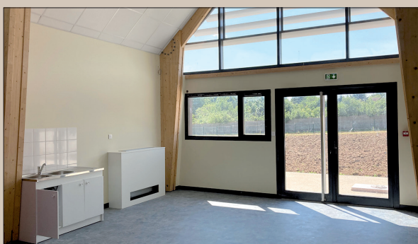
Deux petites salles (40 m 2 ), équipées de placards de rangement et d'un point d'eau.

Après un grand nettoyage du chantier, la réception des travaux, prévue fin juillet, permettra à la mairie de solliciter le passage de la commission de sécurité qui validera la conformité du bâtiment. Celle-ci conditionnera l'ouverture du centre à l'accueil des enfants. Il restera à aménager les espaces verts dans le courant du dernier trimestre.